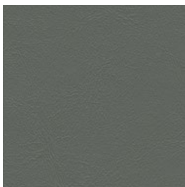
Sea Skin Basalto 1824