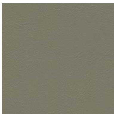
Sea Skin Mineral 1825