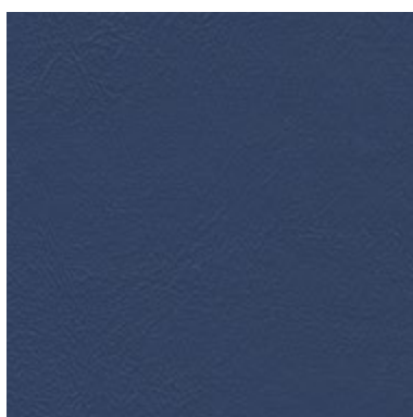
Sea Skin Marino 1827