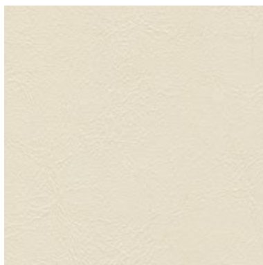
Sea Skin Marfil 1822