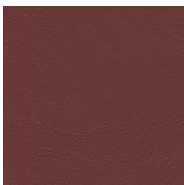
Sea Skin Granate 1829