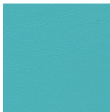
Sea Skin Turkis 1828