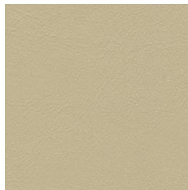
Sea Skin Avena 1823