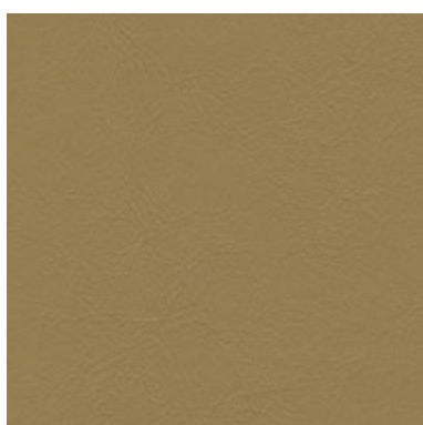
Sea Skin Toffee 1832