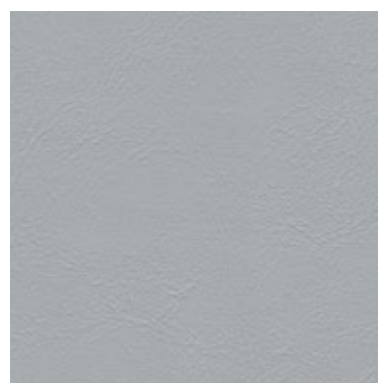
Sea Skin Perla 1826