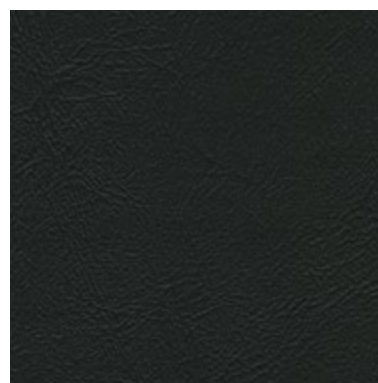
Sea Skin Negro 1830