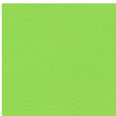
Sea Skin Anis 1831